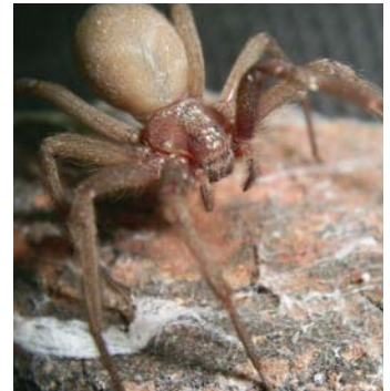
Araña del violín ( Loxosceles laeta )

De las serpientes venenosas de Argentina, las corales son las más coloridas y no son agresivas, si bien su veneno es muy potente, no es común el accidente ponzoñoso. El envenenamiento por estas es neurotóxico causando parálisis neuromuscular.