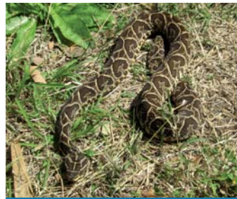
Yarará grande ( Bothrops alternatus )

Conocida con el Nombre yarará chica es una serpiente de temperamento agresivo, es veloz y normalmente de juveniles tienen la punta de la cola color blanca, no suele superar 1,2 m de longitud. De carácter agresivo cuando se siente amenazada.