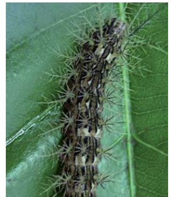
Lagarta o Taturana ( Lonomia obliqua )

Todos los escorpiones poseen veneno, pero sólo el género Tityus ha causado accidentes graves. No superan los 7 cm de longitud, y se los encuentra tanto en el domicilio como en el peridomicilio. Su veneno es neurotóxico y el envenenamiento es especialmente peligroso en niños.