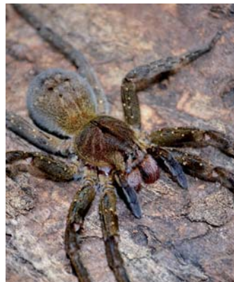
Araña del banano ( Phoneutria sp. )

Es una araña pequeña y colorida, rara vez se la encuentra dentro de los domicilios, son de hábitos diurnos y muy tranquilas, realizan telas a nivel del suelo para capturar a sus presas. Produce envenenamientos neurotóxicos.