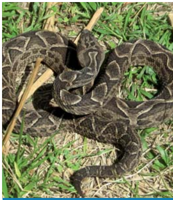
Yarará chica ( Bothrops diporus )

Conocida con el Nombre yarará chica es una serpiente de temperamento agresivo, es veloz y normalmente de juveniles tienen la punta de la cola color blanca, no suele superar 1,2 m de longitud. De carácter agresivo cuando se siente amenazada.