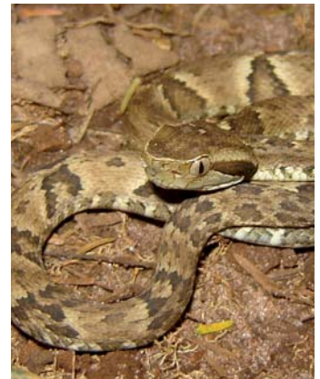
Yararaca ( Bothrops jararaca )

Es la serpiente venenosa de mayor tamaño en Argentina. Al presente sólo se la encuentra en la provincia de Misiones, puede superar 1,80 m de longitud y los accidentes siempre son graves por la cantidad de veneno que pueden inocular.