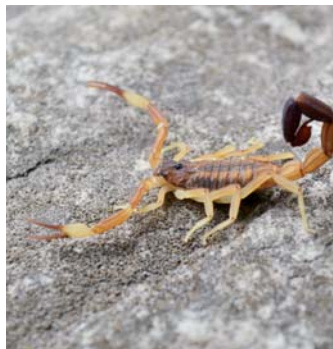
Escorpion o alacrán ( Tityus trivittatus )

Es una araña muy agresiva, de los 3 géneros de arañas de importancia médica en Argentina es la de mayor tamaño. Puede llegar hasta 5 cm de largo corporal (sin patas)