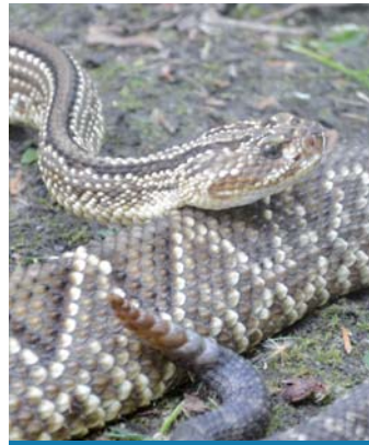
Cascabel ( Crotalus durissius terrificus )

Serpiente de colores marrones claros, de tamaño medio, puede superar 1,5 m de longitud. Están ubicadas al norte de la provincia de Misiones. Vivípara al igual que las demás Yararás y Cascabel, alcanzando a dar a luz entre 15 y 28 viboreznos.