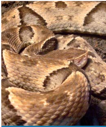
Moojeni ( Bothrops moojeni )

Serpiente de colores ocres claros de tamaño medio y esbelta. Junto a Bothrops moojeni y Bothrops Jararacussu son las 3 yararás que en la actualidad solo se las encuentran en la provincia de Misiones.