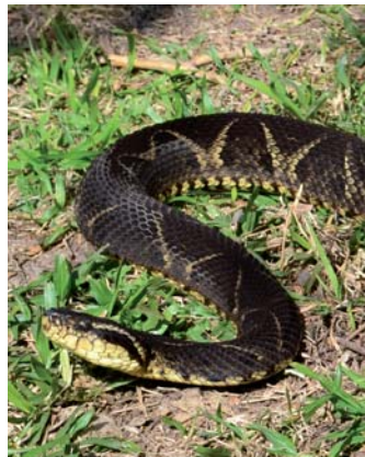
Yararacussu ( Bothrops Jararacussu )

Es la más común de las yararás, junto con la yarará chica son las causantes de la mayoría de los accidentes ofídicos. También llamada víbora de la cruz o cruceira, puede llegar a medir 1,60 mts. de longitud. De carácter agresivo cuando se siente amenazada. Su veneno destruye tejidos y afecta la coagulación sanguínea causando hemorragias y caída de la presión sanguínea.