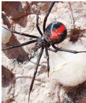
Viuda negra ( Latrodectus sp. )

Es una araña huidiza, y evita la luz. Se la puede encontrar detrás de los muebles pegados a la pared o detrás de los cuadros, no es agresiva aunque pica y accidentalmente. Su veneno causa lesiones locales muy graves y puede haber envenenamiento generalizado grave que afecta los glóbulos rojos y tejidos y conducir a la muerte.