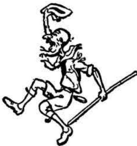
Una vez Scout, siempre Scout

Así que le dije que no quería interferir con la santidad de sus asuntos domésticos, ¿podría decirme algún evento histórico conocido en el que hubiera tomado parte? nada fue más fácil. En la antigüedad, cuando Egipto mandaba un gobernador para regir sobre Sudán, era recibido en Shendy con todos los honores, se le preparó un banquete, pero los habitantes sentían que ninguno de ellos tenía posición suficientemente alta para sentarse a la mesa con tan augusto personaje, así que comió solo en la cabaña que le habían asignado.