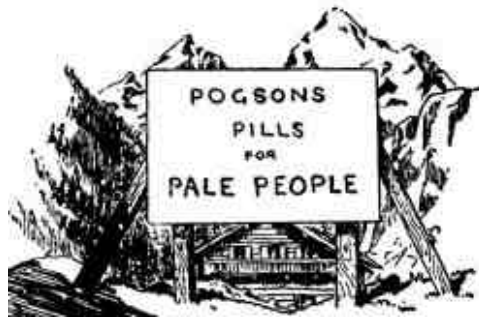
Apreciación de la belleza

"Donde hubo invierno, es ahora primavera"