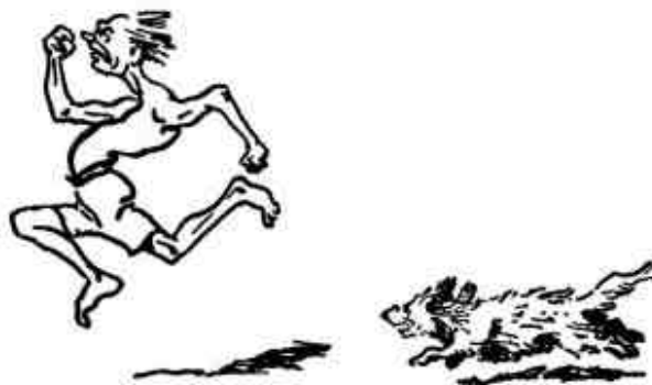
Seguridad ante todo

“Enseño a mis hombres a seguir adelante sin importar las balas, con el espíritu de victoria, mientras que a su ejército en Inglaterra le enseñan a cubrirse para evitar bajas. En una palabra ustedes les enseñan a tener miedo a los proyectiles antes de llegar a la línea de fuego. Si inculcan miedo físico, puede desarrollarse el miedo moral”.