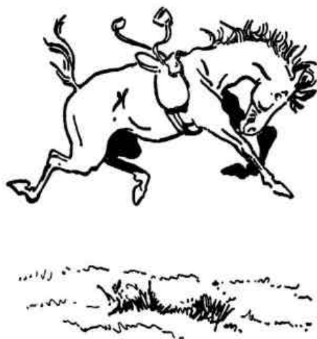
El espíritu del lunes por la mañana

Mi hijita fue tirada una vez de su caballo. Éste había estado dos días en el establo, sin ejercicio y bien alimentado con avena. Expliqué su comportamiento como debido a lo que llamamos "enfermedad del lunes en la mañana" que ocurre cuando un caballo ha tenido dos días de descanso y sale al campo, lleno de energía para reanudar su trabajo.