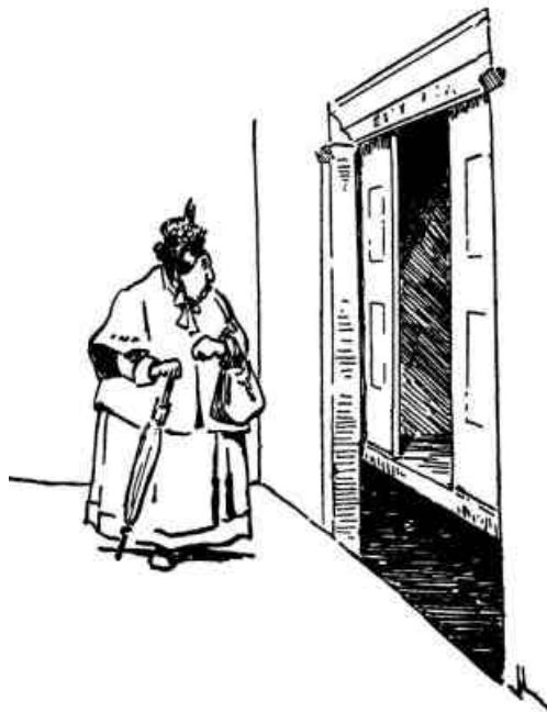
La que duda, pierde

Hay sin embargo, algunos tropiezos morales que pueden presentarse al joven que emprende el camino de la vida, y debe prevenirse por los viejos que ya pasaron por ahí.