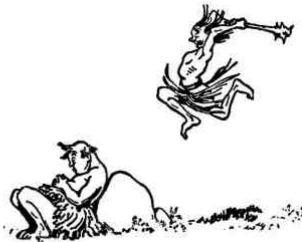
Viejo remedio para los que no hacen nada

Era una ocasión momentánea e impresionante en un punto de retomar su vida, la cual, como regla, influenciaba su carácter y su conducta posterior.