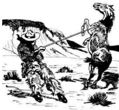
Dibujo de la portada original del libro.