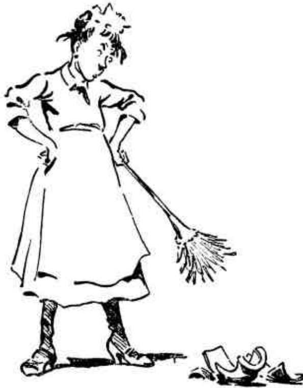
Cambio y destrucción en todo lo que veo

Por otro lado, el hábito de fumar es cómodo al fumador pero una molestia para otros, frecuentemente vulgar y él es el último en enterarse. Aún así, a diario puedes ver hombres que llenan un vagón de no fumadores con humo que se quedará ahí enfermado a las damas y a los que viajen después.