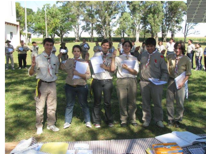
Egresados del Curso Nivel I