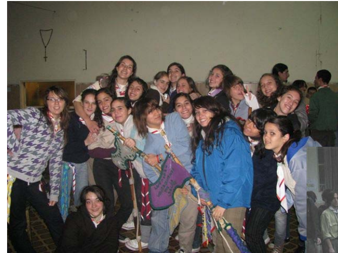
Despedida de Mara